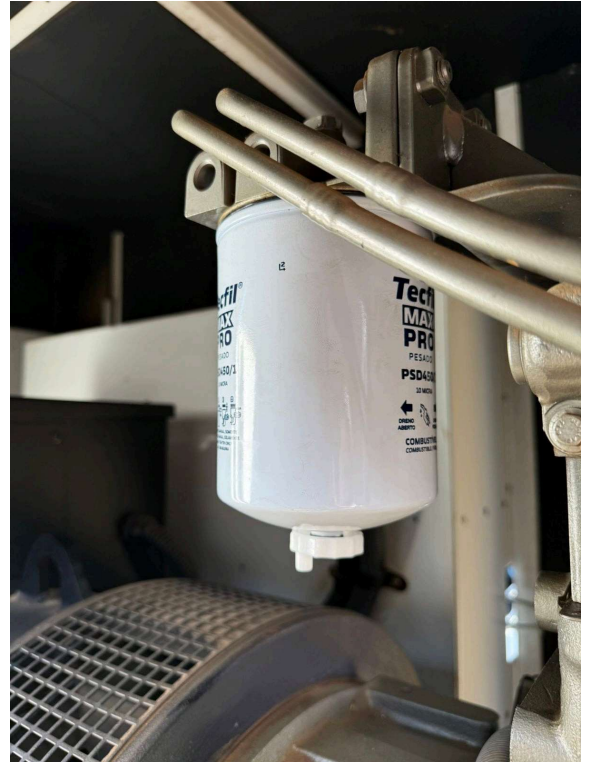
FILTRO XXXXXX NOVO