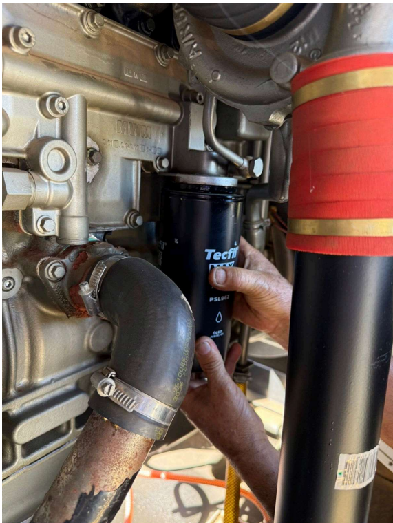
FILTRO XXXX ANTIGO