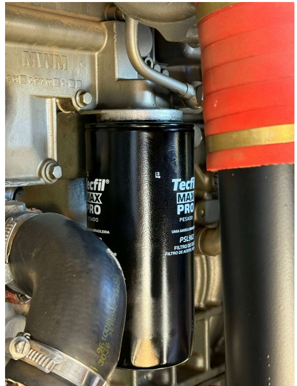
FILTRO XXXXX NOVO