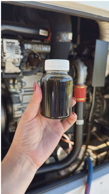
RETIRADA DO ÓLEO ANTIGO E COLETA DE AMOSTRA