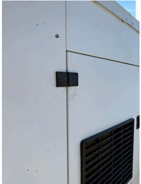
ANTES DA LIMPEZA