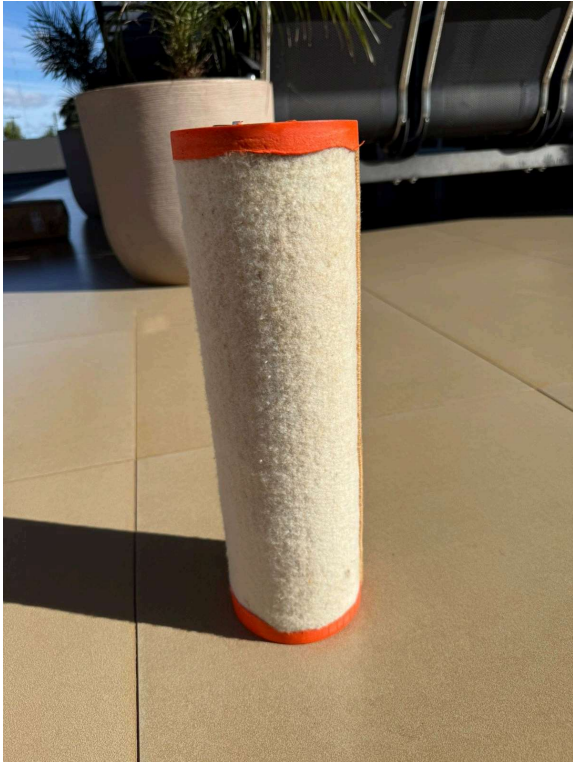
FILTRO XXXXXX ANTIGO