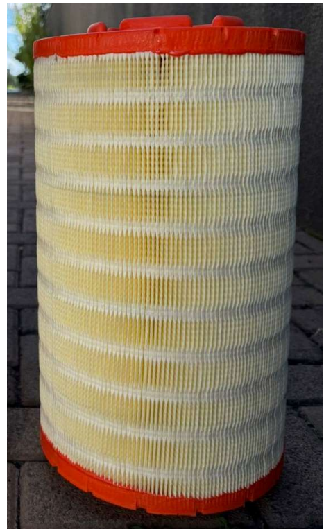
FILTRO XXXXXXXX NOVO