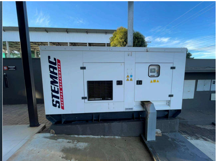
APÓS A LIMPEZA