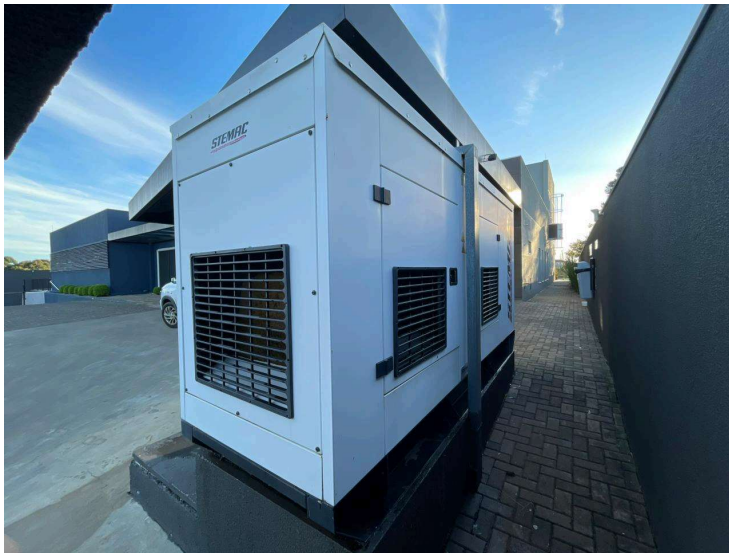
APÓS A LIMPEZA