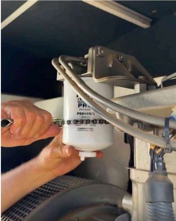
FILTRO XXXXXXXX ANTIGO