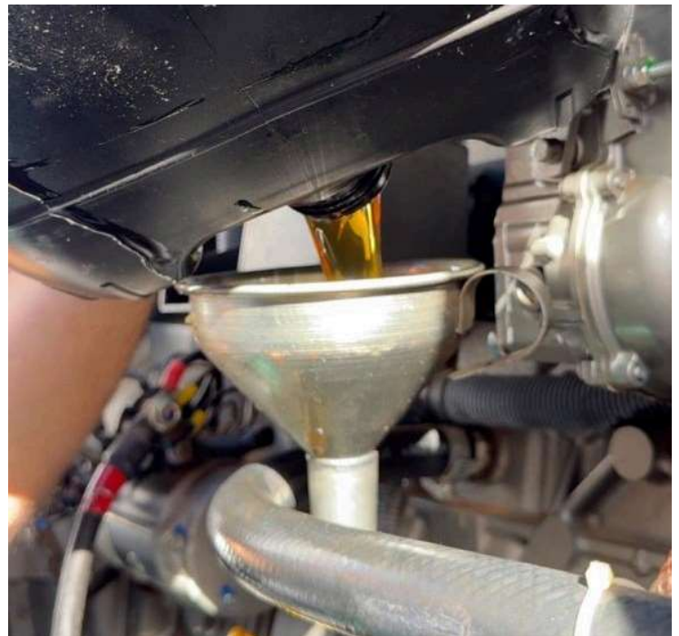
ABASTECIMENTO ÓLEO NOVO