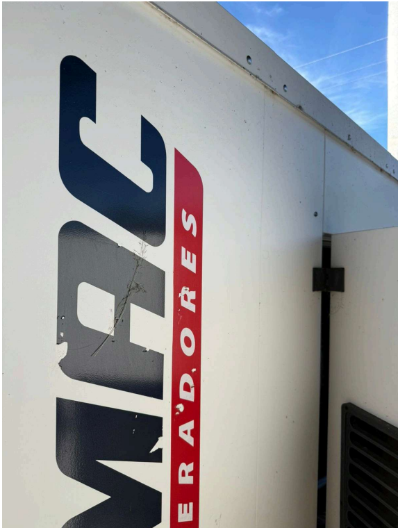
ANTES DA LIMPEZA