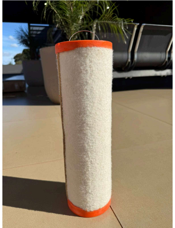
FILTRO XXXXXX NOVO