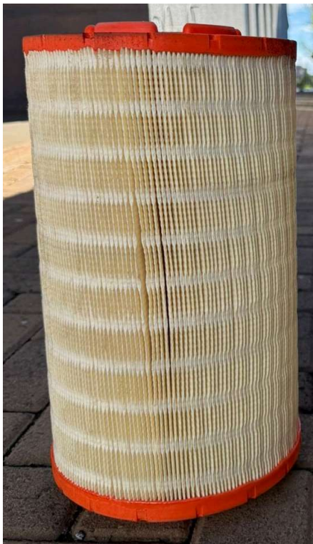
FILTRO XXXXXX ANTIGO